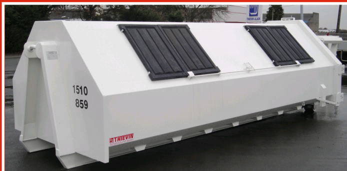
PHOTO FERMETURE A VENIR

*Photos et plans donnés à titre indicatif