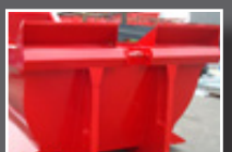
Casquette sur face avant