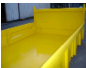
Angle de fond à 90°