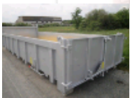
Porte universelle (simple/double articulation) Déverrouillage manuel ou hydraulique