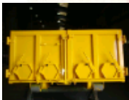
Trappe enrobé ou céréales