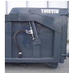
Porte hydraulique TP